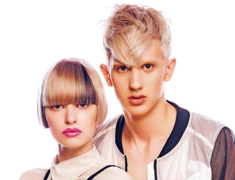
Die Trendfrisuren für Damen und Herren kombinieren weiche Strukturen mit harten Konturen.

Auch feine Mini-Wellen und deutlich erkennbare Stufenschnitte mit